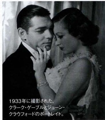
1933年に撮影された、クラーク・ゲーブルとジョーン・クラウフォードのポートレート。

■「Glamour of The Gods: Hollywood Portraits」 ~10月23日 National Portrait Gallery St Martin's Lane, WC2 ☎+44(0)20.7306.0055 時10:00~18:00(木・土~21:00) www.npg.org.uk